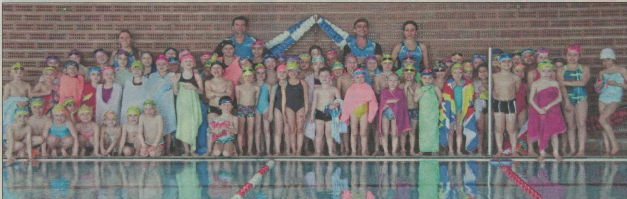
Les jeunes Dauphins du club grassois se retrouvent les mercredis à la piscine Harjès.

Tous les mercredis après-midi, le club accueille près d'une centaine de jeunes nageurs, à la piscine Harjès, pour un apprentissage et un perfectionnement de la discipline